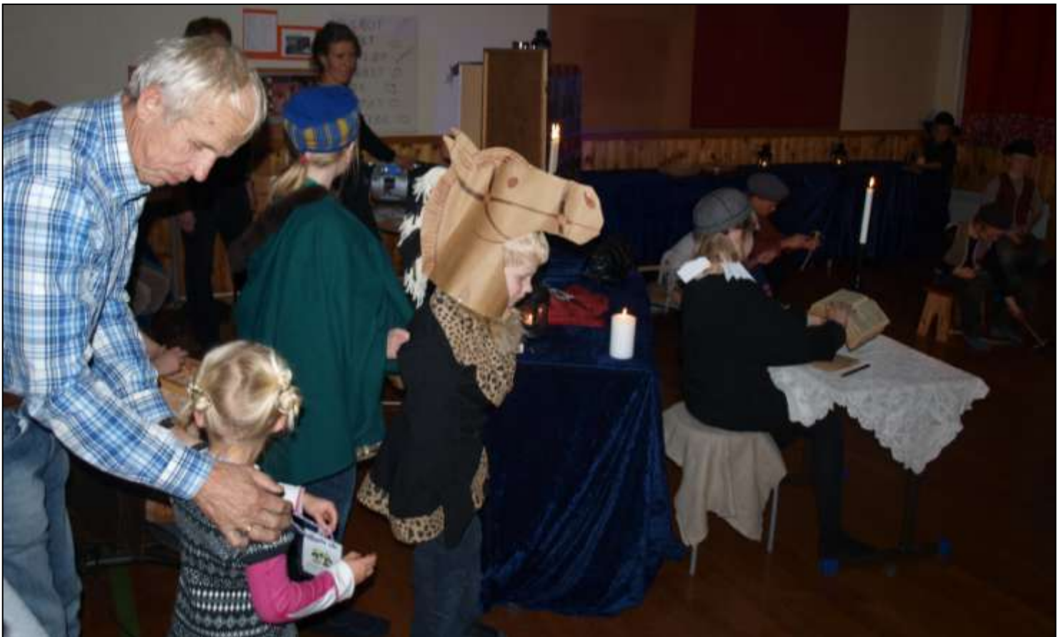
God kontakt mellom aktører og publikum i teaterforestillingen.