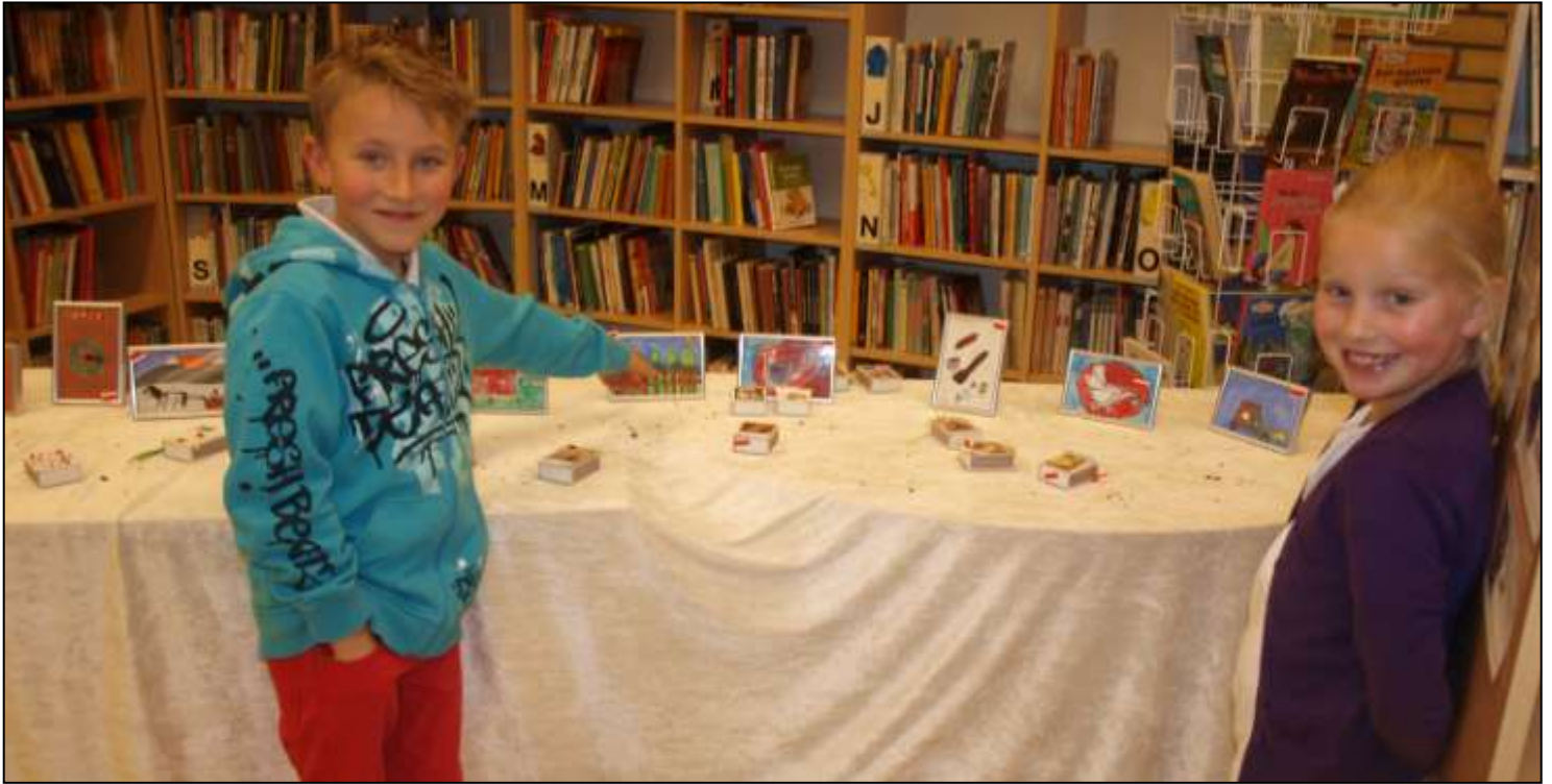
Alt klart for salgsutstillingen