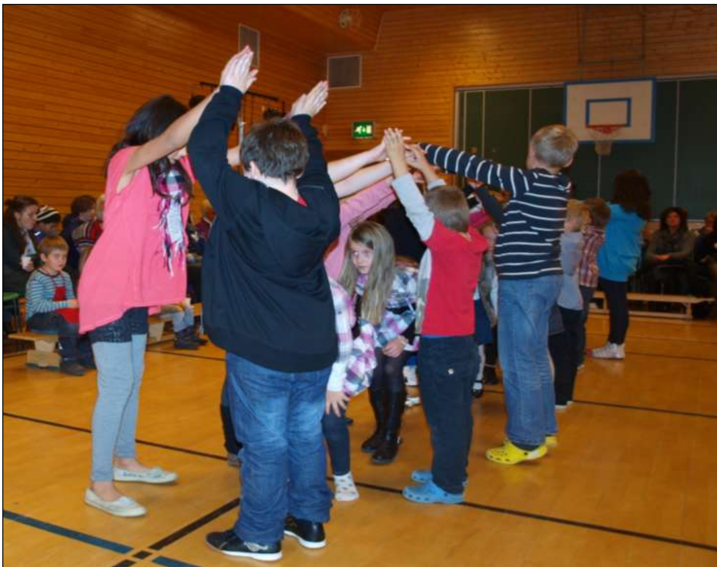
Ei konsentrert dansegruppe er midt i Polonesen

Hilsen elever og lærere ved Høyjord skole