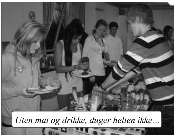
Uten mat og drikke, duger helten ikke...

Kjellerklubben hadde Filmmaraton en week-end i mars for åttende klasse og oppover. Rundt femti ungdommer valgte å benytte seg av tilbudet, og de fleste av dem tilbrakte tiden fra klokken 18.00 på fredagen til klokken 15.00 på søndagen. Vi lar et knippe bilder fortelle litt om den helgen.