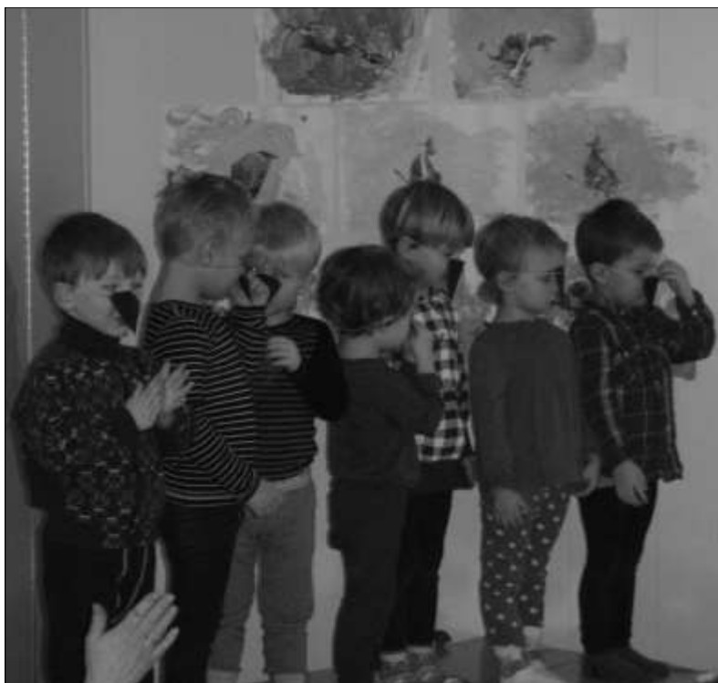
Tre-åringene som kråker etter Mamma Mø og Kråka

gedag var VI KAN , så da måtte vi jo vise fram hva vi i Høyjord barnehage har drevet med, og hva vi kan! Vi hadde hengt opp mange av våre prosjekter på veggene på kjøkkenet, slik at foreldrene kunne gå og kikke på dem. Førskolebarna hadde hengt opp mye av det de har drevet på med i førskolegruppen sin – bl.a former og figurer, tall, diktskriving og bilder av eksperimentering på vann. Fireårskullet hadde hengt opp kunstverk de hadde laget ved hjelp av maling og sugerør i forbindelse med sitt prosjekt med Språklek, Treårskullet hadde stilt ut sine kunstverk om Mamma Mø og Kråka, som er deres tema, og to- og ettåringene hadde stilt ut sin vinterkunst. I tillegg hadde vi laget en lysbilde fremvisning som sto og gikk på kjøkkenet, slik at foreldrene kunne se noen hverdagsbilder fra barnehagen.