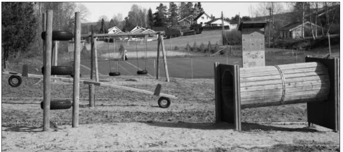
Vedlikehold av nærmiljøanlegg krever både økonomiske og menneskelige ressurser.