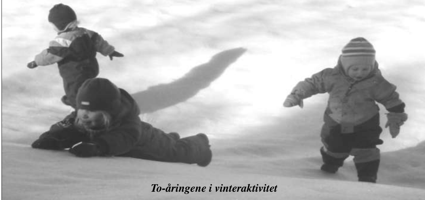
To-åringene i vinteraktivitet

Nå på tidligvåren har vi hatt to flotte arrangementer her i Høyjord barnehage. Den 15.mars ble barnehagedagen markert i mange av landets barnehager. Vi i Høyjord barnehage markerte dagen ved å invitere til foreldrekafe på slutten av dagen. Slagordet for årets barneha-