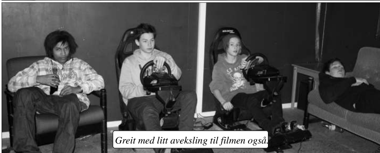
Greit med litt aveksling til filmen også.