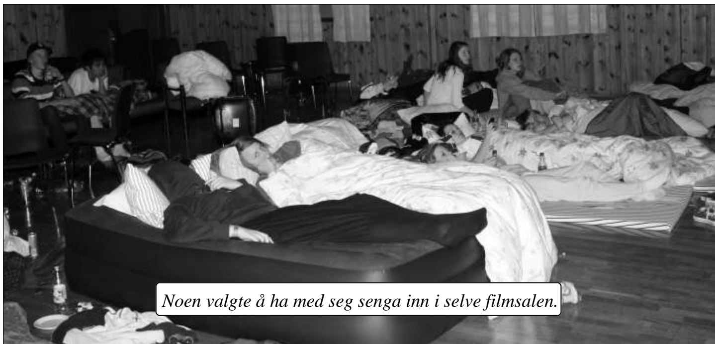
Noen valgte å ha med seg senga inn i selve filmsalen.