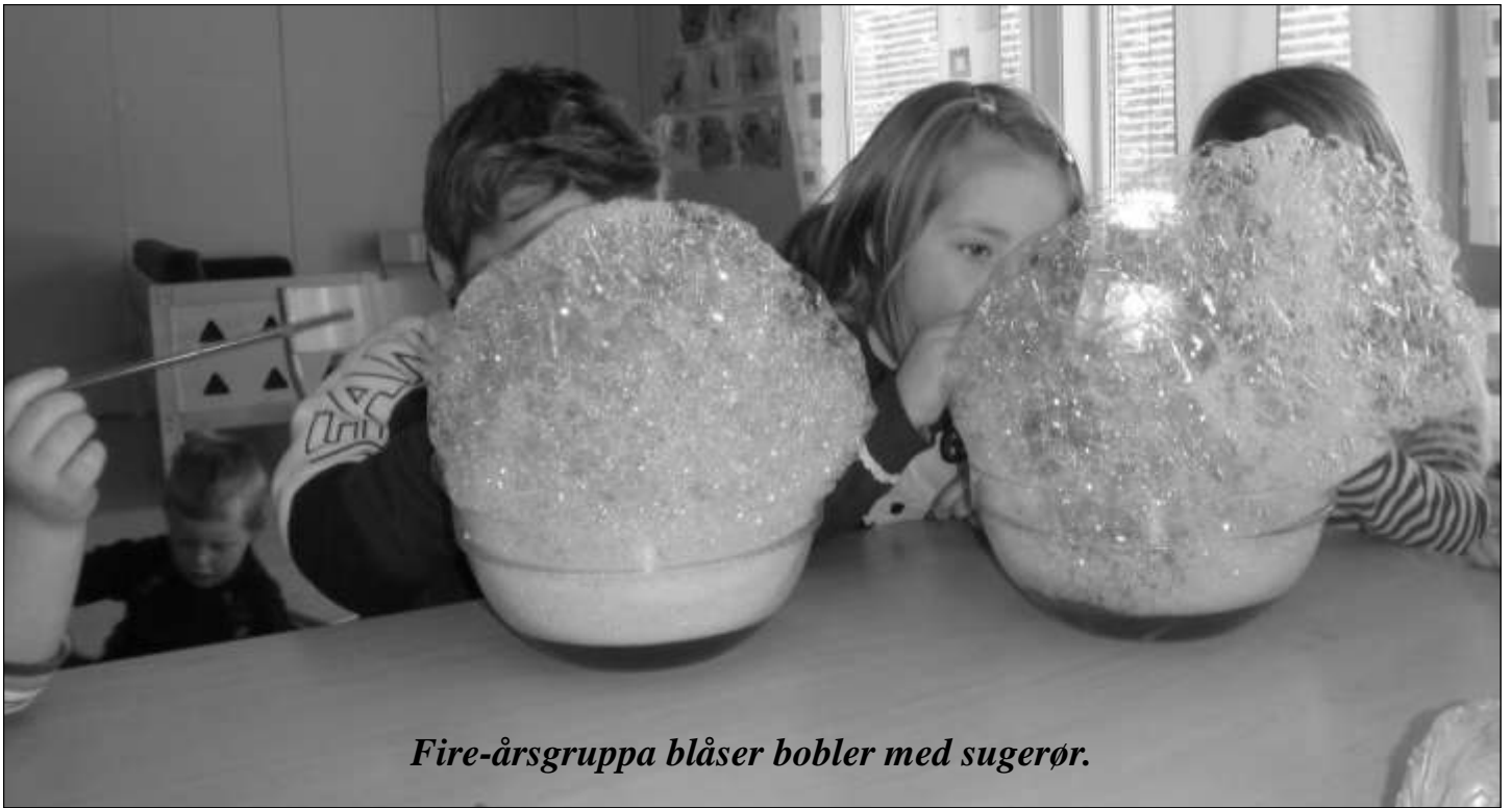
Fire-årsgruppa blåser bobler med sugerør.