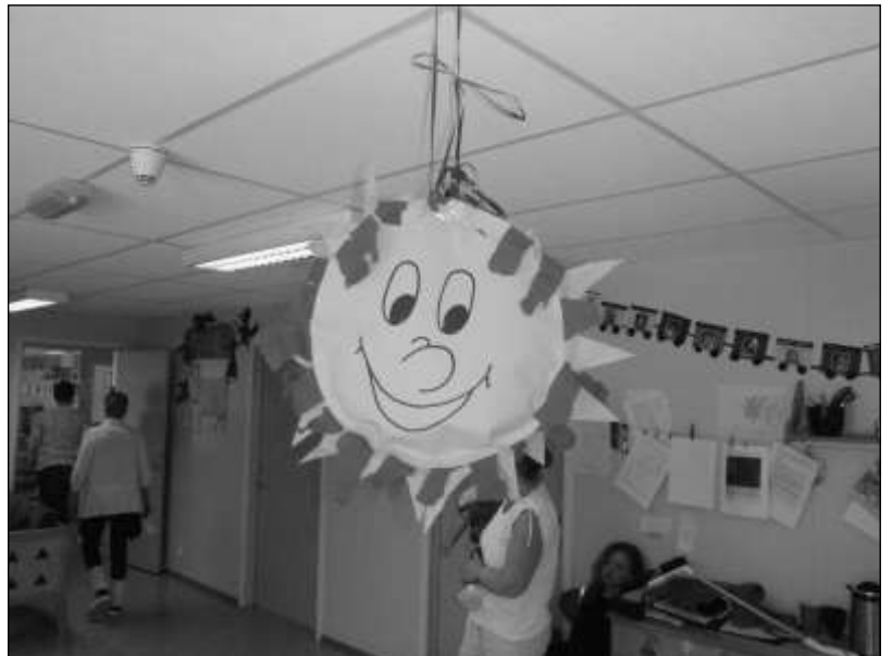
Sola vi slår våren ut av.