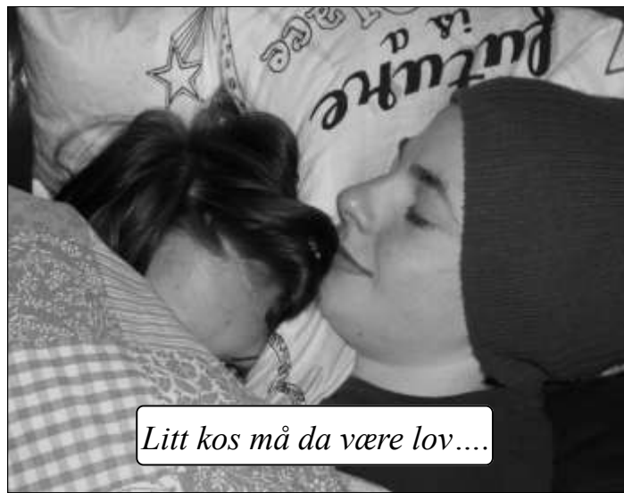
Litt kos må da være lov....